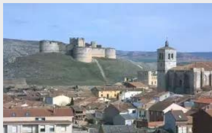
La Villa de Berlanga de Duero