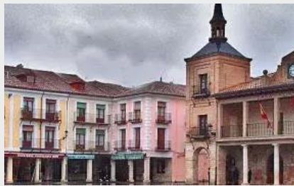
La Ciudad del Burgo de Osma