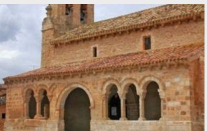
La Villa de Rejas de San Esteban