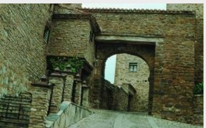
La Villa de Yanguas