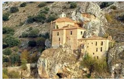
La Margen Izquierda del Río Duero a su Paso por la Ciudad de Soria