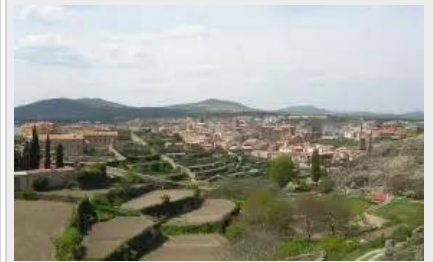
La Villa de Ágreda