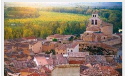
La Villa de San Esteban de Gormaz