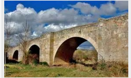
El Pueblo de Langa de Duero