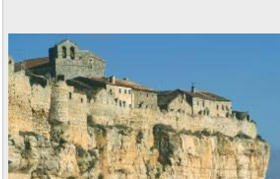
La Villa de Reyó