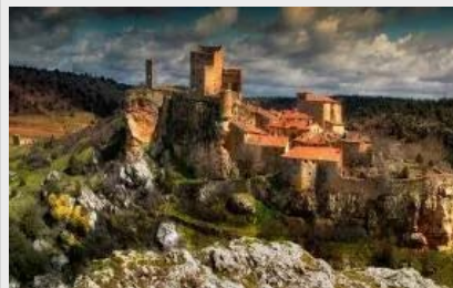
La Villa de Calatañazor