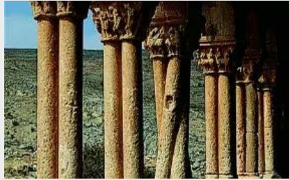
Conjunto Histórico de Caracena