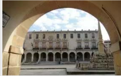
El Casco Antiguo de la Ciudad de Soria